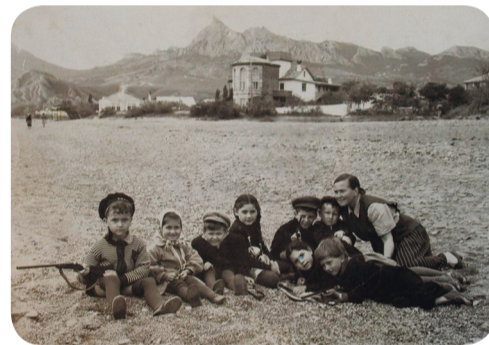
Дом Волошина, 1930 г.

входившая в литературу и разряжавшая свою энергию в остроумии, поэтических турнирах, литературных спорах, всякого рода выдумках. Розыгрыши, мистификации, стимулируемые неугомонным хозяином, служили испытанием, через которое пропускались новички, были эффективным средством от снобизма и «здорового рассудка» обывателей.