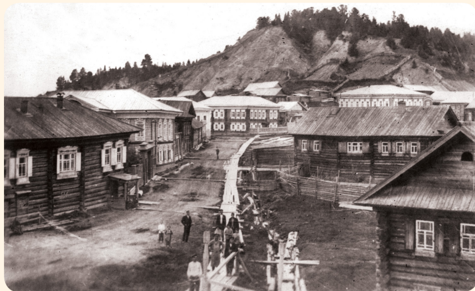
Улица с дорогой и деревянным тротуаром в селе Самарово Фотография А.И. Галкина. 1909 г.

В рамках Года литературы посетителям было предложено по-новому взглянуть на село Самарово, через призму образов его жителей, их взглядов на мир, тесных и разносторонних взаимоотношений, которые отразились в эпистолярном жанре. Письма, воспоминания, книги и рассказы подкреплены визуальными