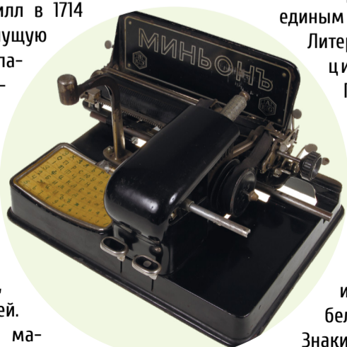
Печатная машинка «Миньонь»

Печатная машинка когда-то была принадлежностью тех, кого принято называть людьми интеллектуальных профессий: учёных, журналистов, писателей. Так, например, печатная машинка «Remington» занимала цен-