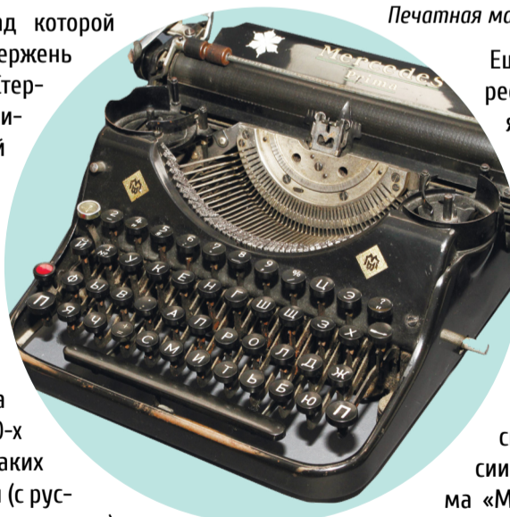
Печатная машинка «Mercedes»

Ещё одним интересным экспонатом является машинка «Mercedes», изготовлена германской фирмой Mercedes Buromaschinen Werke A.G. Данная модель с 20-х гг. XX века производилась специально для России. В это время фирма «Mercedes» оснащала