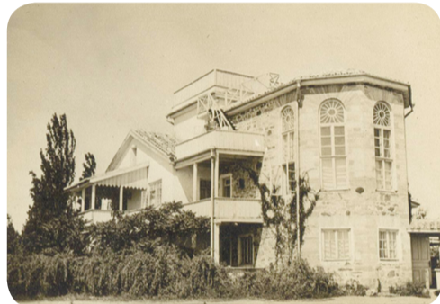
Дом Волошина, 1916 г.

«Дом Волошина в Коктебеле был одним из культурнейших центров не только России, но и Европы», – утверждал поэт Андрей Белый. В период приезда гостей