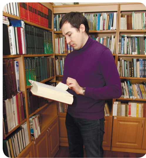
Библиотека в наши дни