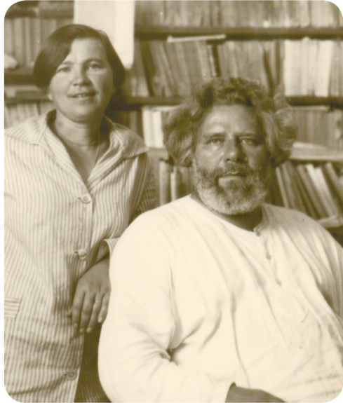
Волошин с супругой, 1925 г.