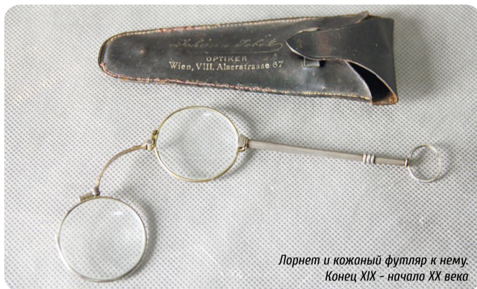
Лорнет и кожаный футляр к нему. Конец XIX – начало XX века

зафиксированной на изящной рукоятке. По центру дужки соединяющей линзы с внутренней стороны имеются прямоугольные клейма в виде цифры 800 и изображение головы Дианы и цифры 3. О чём говорят эти клейма? До 1866 года в Австрии серебро клеймилось в лотах (как в Германии). С 1866 года на серебро были введены стандарты: 750, 800, 900, 950. С 1872 года было введено новое клеймение – голова Дианы. В шестиграннике изображалась голова Дианы, слева от головы ставилась цифра, соответствующая пробе серебра, так 2 – это 900 проба серебра, а 3 – 800 проба.