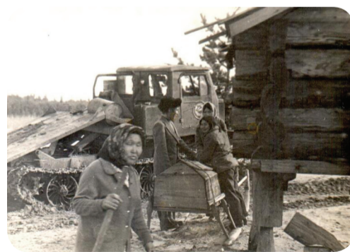
Из истории музея

которое смотрится местное сообщество, пытаюсь отыскать в нём свой образ, зеркало, в которое местные жители дают заглянуть пришельцам, чтобы те могли лучше понять место, в котором они очутились и прониклись уважением к труду, обычаям и особенностям живущих здесь с давних времен людей». Обычный этнографический музей говорит о традиционной культуре «в третьем лице», описывает