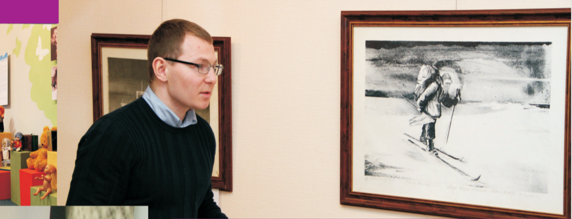
На открытии выставки работ путешественника Фёдора Конюхова