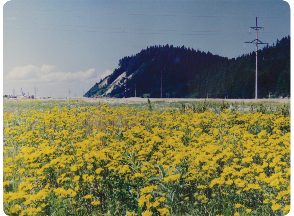
Заводный мыс. Санаторская гора

Книга Юрия Гордеева «От морозов до морозов» вышла в 2000 г., она представляет результаты фенологических наблюдений, которые проводились на территории округа разными специалистами, работающими на особо охраняемых природных территориях. Можно догадаться, что поэтическое название у книги, символизирующее круговорот явлений природы в течение года, появилось благодаря Ю.И. Гордееву, его умению найти точный образ. В книге есть фотографии автора, фенологические заметки, соотнесённые с русским народным календарем и календарём ханты и манси. Фенологический календарь Ханты–Мансийска, составленный на основе 30-летних наблюдений – настольная книга для натуралистов, живущих в нашем крае. Отрывок из книги: «Апрель примечателен тем, что среднесуточные температуры воздуха переходят через ноль градусов, и начинается метеорологическая весна. Правда, не на всей территории округа одновременно – из-за большой его протяженности. На юге, например, в Шаиме, начинается раньше – 4 апреля, в Леушах – 11 апреля, в Ханты–Мансийске – 17 апреля. На севере, в Казыме – 29 апреля, в Саранпауле – 1 мая, в Берёзово – 3 мая... По всему округу