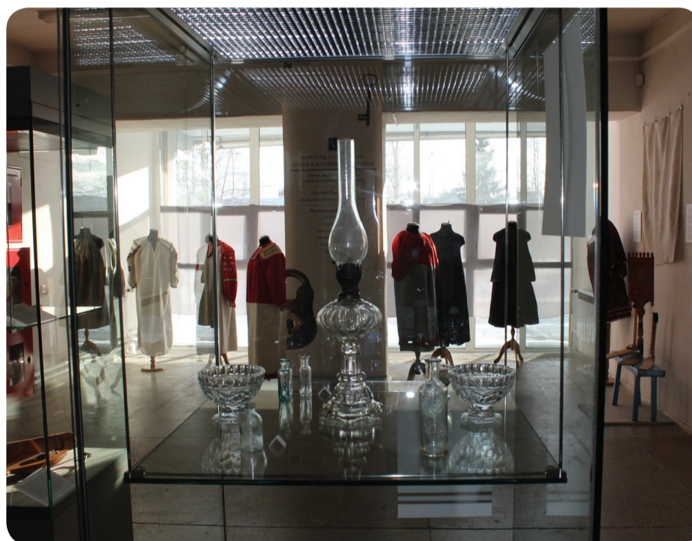
Выставка «Раритеты и артефакты»

В год празднования сорокалетнего юбилея Нижневартковский краеведческий музей представит несколько ярких проектов – выставку «Раритеты и артефакты: новое в музейном собрании», культурно-образовательную программу «Музеи Нижневартовска», детскую выставку «Если бы я создавал музей», фольклорный праздник «Гуляния на Первомайской», на котором