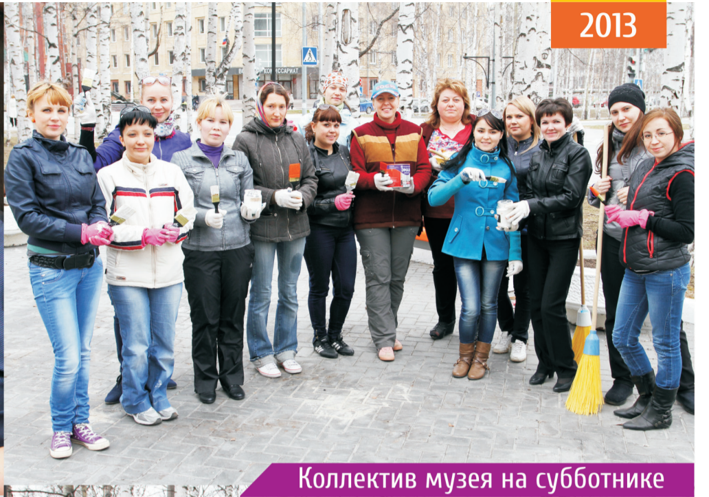
Коллектив музея на субботнике