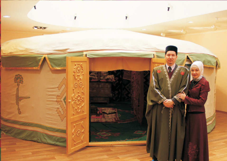
Выставка «Материальная культура башкирского народа»