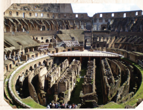
Амфитеатр Флавиев (Колизей)

своими сокровищами разве что неподготовленного посетителя. Знающие замирают возле величайших шедевров, а обтекающий их людской поток становится просто досадной помехой, со временем уходящей на второй план. Впрочем, если торопитесь – дойдите, хотя бы до «Капитолийской волчицы» и «Мальчика, извлекающего занозу»,