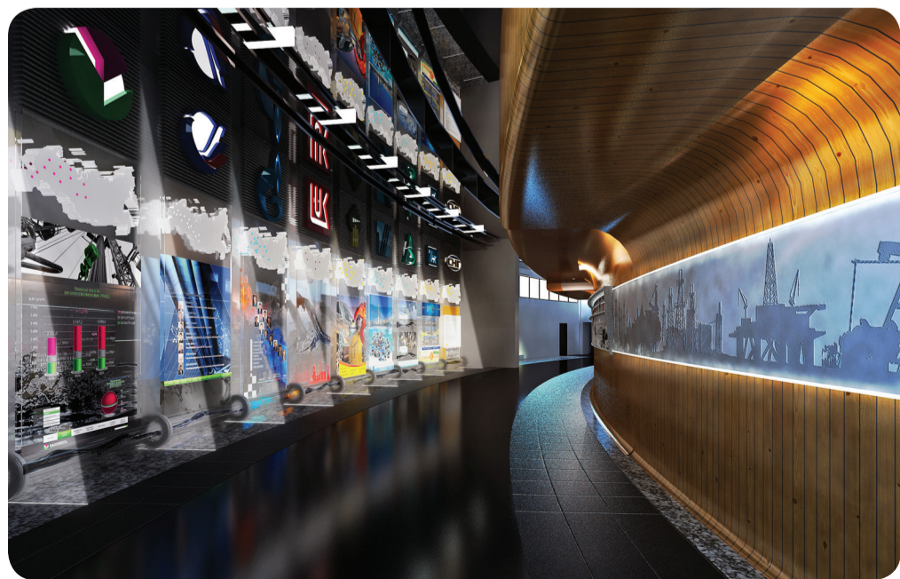
Проект стационарной экспозиции музея

Музейный фонд размещается в специально оборудованных хранилищах. Помещения музейного фондохранилища оснащены уникальным технологическим оборудованием, позволяющим находиться музейным предметам, в том числе, в условиях открытого доступа для посетителей. В служебных помещениях фондовых отделов имеется специализированный кабинет для дофоновой обработки материалов, их обеззараживания.