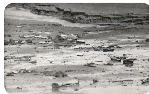
Луговское местонахождение. Кости мамонтовой фауны.

разрушается зимний путь, деревушки и крохотные посёлки оказываются на островах, как Робинзоны. До вскрытия рек и начала навигации к ним не добраться».