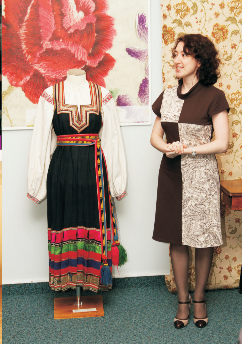
Выставка «Волшебные нити Макоши»