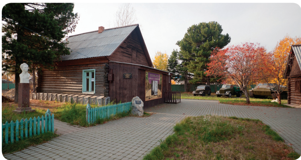
Дом Ф.К. Салманова