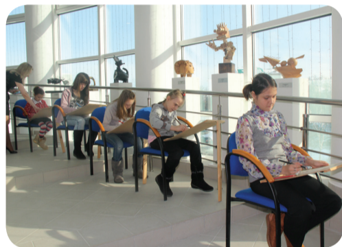
Культурно-образовательные мероприятия музея