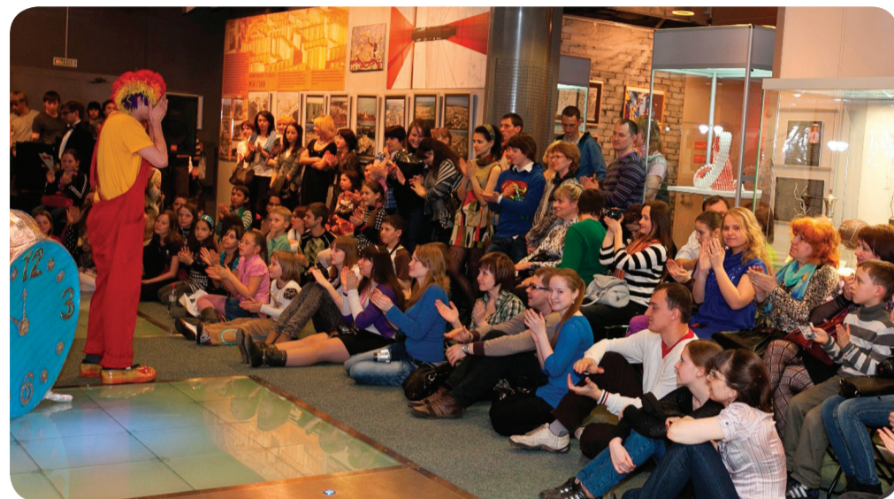
Ночь в музее. 2011 г.

ных конкурсов А.В. Заики, который с 2001 г. участвует во всех экспедициях музея. Созданные им уникальные фотоматериалы удостоиваются высокой оценки профессионалов, получают дипломы отечественных и международных конкурсов. Часть работ А.В. Заики пополнила фонд Русского музея.