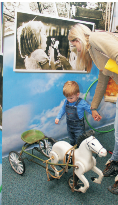
Выставка «Остров детства моего»