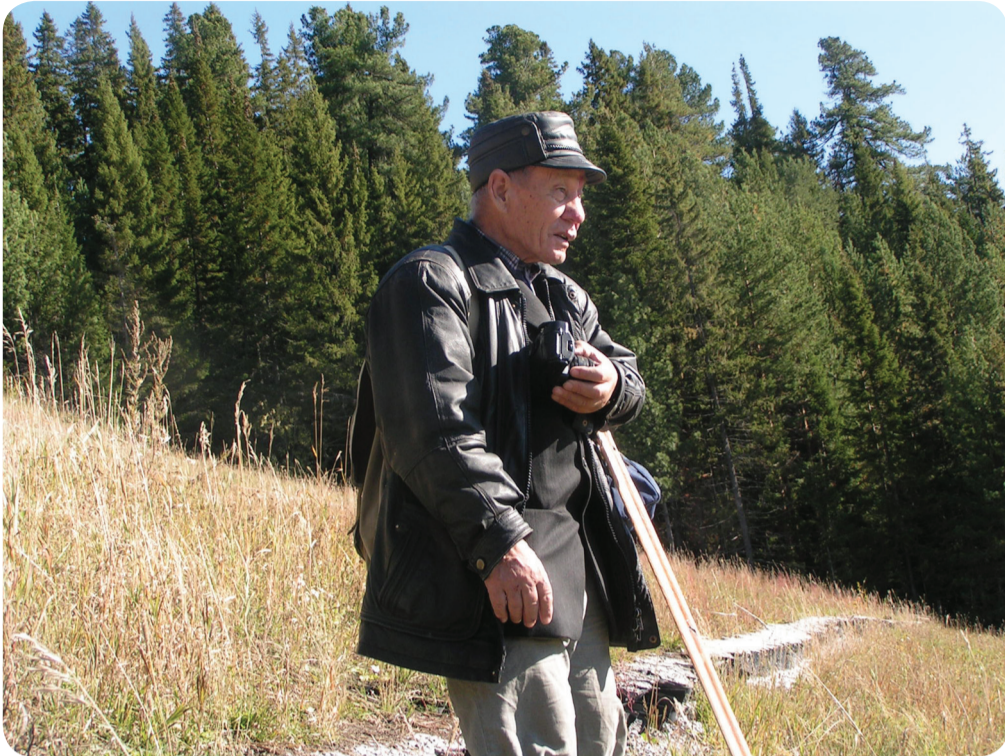
Юрий Иванович Гордеев

Посвящается памяти Юрия Ивановича Гордеева (1931–2008 гг.), краеведа–фенолога, орнитолога, заслуженного эколога Ханты–Мансийского автономного округа – Югры, сотрудника Окружного краеведческого музея (ныне Музея Природы и Человека г. Ханты–Мансийска).