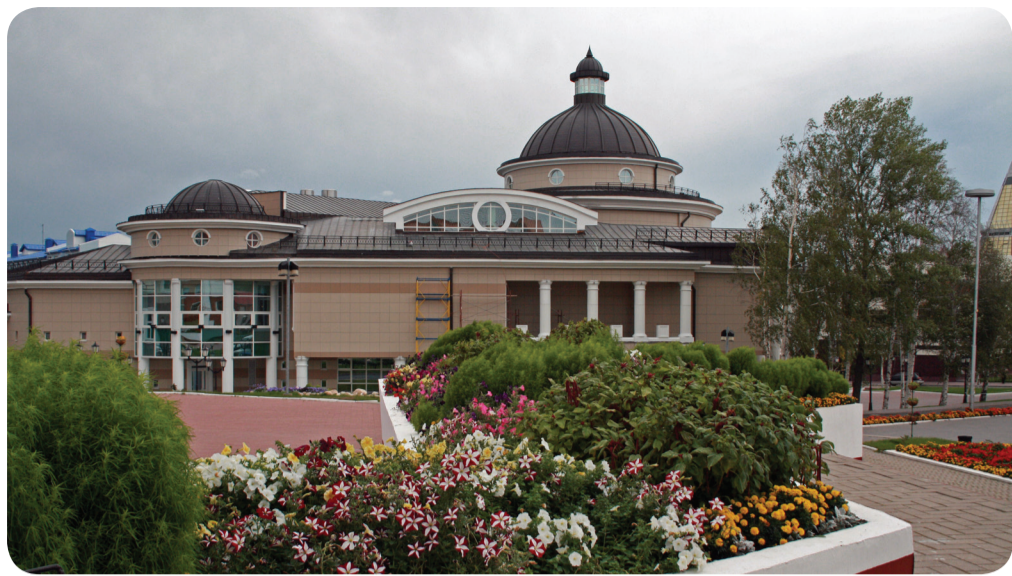
Государственный художественный музей

Особое внимание в работе музея уделяется формированию и развитию профессиональных связей между музеями Югры через сотрудничество в решении совместных задач, планировании и воплощении в жизнь арт-проектов. Эту сферу деятельности охватывает цикл «Музейные коммуникации». К наиболее значимым мероприятиям цикла относится «Музейный альянс» – окружной художественный фестиваль лучших музейных проектов, участники которого представляют экспозиции из фондов своего музея. Проведение фестиваля направлено на консолидацию творческих сил художественных музеев и галерей ХМАО-Югры в деле развития и совершенствования музейной сферы Югры. В рамках фестиваля демонстрируются