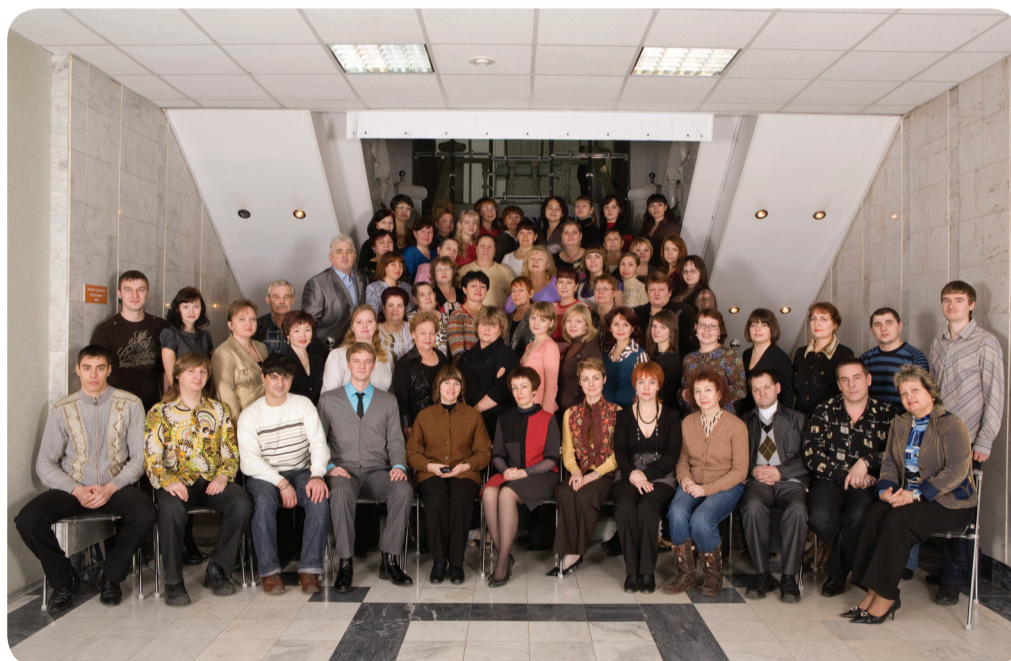
Коллектив Сургутского краеведческого музея

Накануне юбилейного торжества в музее состоится III научно-практическая конференция «Сибирь в музейных и академических исследованиях». Кульминацией Юбилея станет открытие выставочного проекта «Перекрёсток времён», которое состоится 27 ноября.