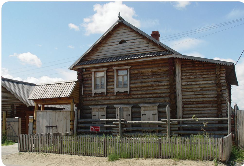
Музей истории русского быта